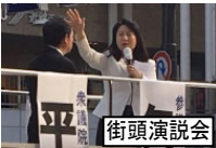
様々な場面で、国政の現状を訴えさせていただきました 街頭演説会