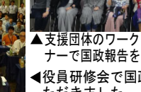
▲支援団体のワークライフバランスセミナーで国政報告をさせていただきました ▲役員研修会で国政報告をさせていただきました