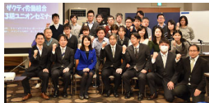
▲加盟組合の会議・セミナーで国政報告をさせていただきました