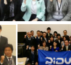
多くの皆さんが国会事務所にお越しくださいました