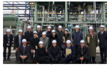
▲エネルギー施設(水素供給事業)を視察させていただきました