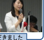
支援組織の定期大会で挨拶をさせていただきました