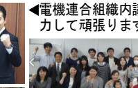
◀電機連合組織内議員の皆さんと協力して頑張ります