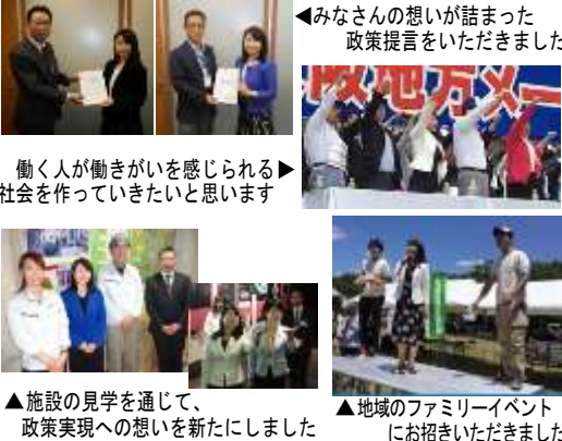
◀みなさんの想いが詰まった政策提言をいただきました 働く人が働きがいを感じられる社会を作っていきたいと思えます ▲施設の見学を通じて、政策実現への想いを新たにしました ▲地域のファミリーイベントにお招きいただきました