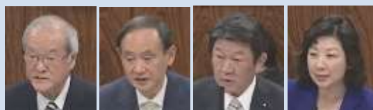
鈴木内閣官房長官 菅内閣官房長官 茂木内閣官房長官 野田総務大臣

★質問の詳細は、 YouTube やたわかチャンネルに掲載している国会質問動画をご覧ください!