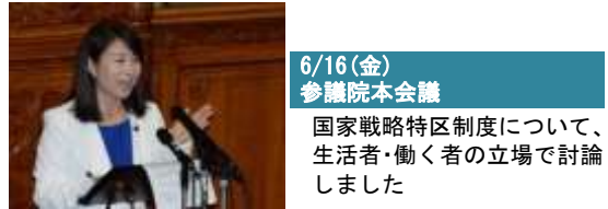
6/16(金) 参議院本会議 国家戦略特区制度について、生活者・働く者の立場で討論しました