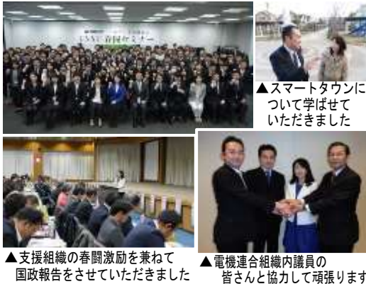
▲スマートタウンについて学ばせていただきました ▲支援組織の春闘激励を兼ねて国政報告をさせていただきました ▲電機連合組織内議員の皆さんと協力して頑張ります