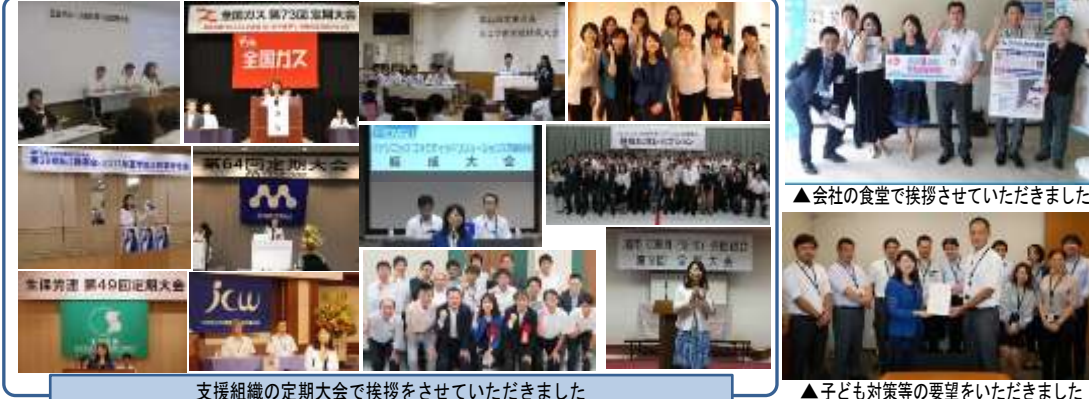
支援組織の定期大会で挨拶をさせていただきました ▲子どもの対策等の要望をいただきました