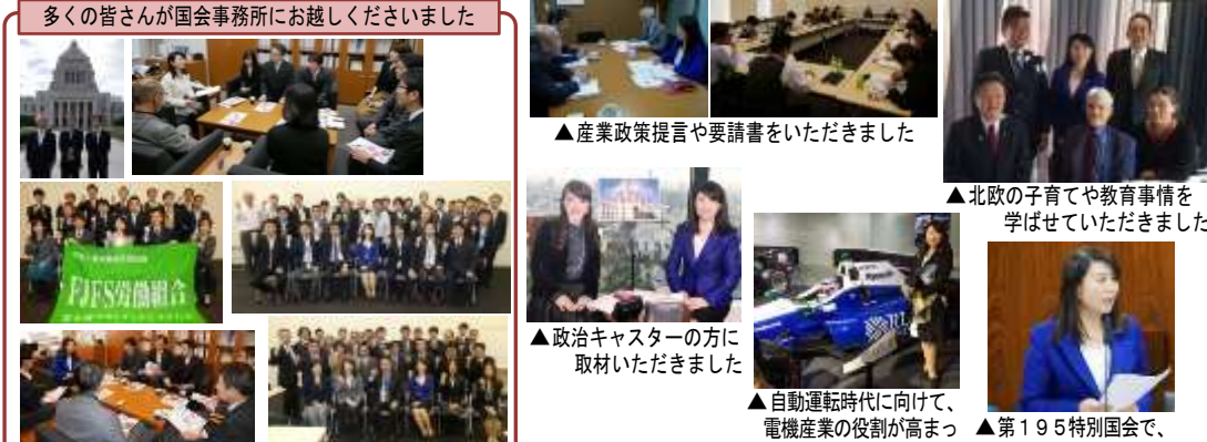
多くの皆さんが国会事務所にお越しくださいました ▲産業政策提言や要請書をいただきました ▲北欧の子育てや教育事情を学ばせていただきました ▲政治キャスターの方に取材いただきました ▲自動運転時代に向けて、電機産業の役割が高まっていると再認識しました ▲第195特別国会で、質問をさせていただきました